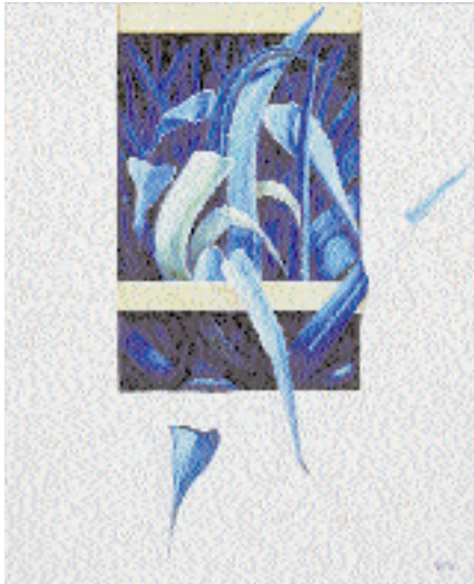
Silent Power, Öl auf Leinwand, 1998, 120 x 100 cm