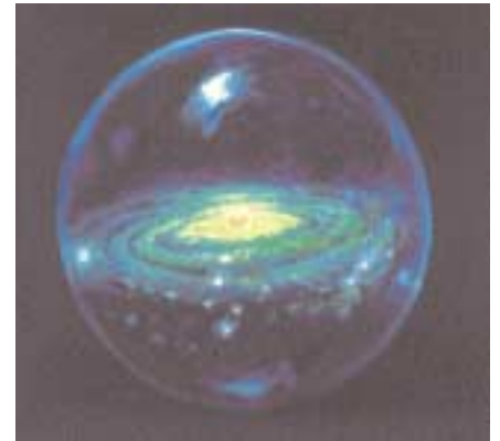
Geburt des Adam, Öl auf Leinwand, 1998, 100 x 100 cm