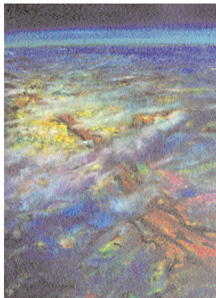
African Flight, Öl auf Leinwand, 162 x 129,50 cm, 1999

Neben dem Motiv des Selbstbildnisses ist auch die Art und Weise seines Entstehens charakteristisch für die Arbeitsweise des Künstlers. Nach seiner Entscheidung für die Kunst und gegen die Medizin wirkt herb-art befreit, ja entfesselt. So entstehen Bilder, die explosiv auf die Leinwand geworfen werden, möglichst schnell, bevor das „innere Bild“ davon sich wieder auflöst. In einem Vorgang fertig gemalt. Am nächsten Tag wird nichts mehr korrigiert. Seine Sujets seien Botschaften aus den Tiefen seiner Seele, erklärt herb-art, für ihn selbst – und vielleicht auch ein Denkanstoß für Andere.